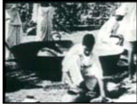
مردم هند برای تولید نمک متحد شدند.

طرز منطقی قابل دسترسی. یک هدف از برای جنبش اهمیت بیشتری برای پیگیری داشته باشد از کارآیی استراتژیک بیشتری برخوردار است. به عبارت دیگر مبارزاتی را انتخاب کنید که الف - برای افراد داخل جنبش و جامعه معنایی والا داشته باشد. ب - شما قابلیت برنده شدن واقعی را داشته باشید. برای مثال در جنبش استقلال هندی ها علیه حکومت انگلستان ، امکان تولید نمک و نپرداختن مالیات به آن ، به راحتی برای مردم عادی بود و با به راه انداختن راهپیمایی نمک در سال 1930 ، گانندی توانایی حمله به انحصار طلبی انگلیس در تولید نمک را پیدا کرد که تقریباً تمامی اعضای جامعه هندی را تحت تاثیر قرار داد. هدف گانندی در خاتمه دادن به انحصار نمک توسط انگلیسی ها هم قابل دسترس هم هم شفاف بود و گانندی قدرت خود - تعداد زیادی از افراد تهیج شده - علیه نقطه ضعف انلیس - یک قانون غیرقابل اجرا برای دفاع کردن از آن به شکل سیاسی و یا توجیه زندانی کردن افراد به خاطر مخالفت با آن - بکار برد. این مهم است که جنبش یا پیکار تعداد نسبتاً محدودی از اهداف داشته باشد در غیر این صورت رسیدن به اتحاد و توافق نظر در میان گروهها و سازمانهای مختلف درگیر بسیار مشکل خواهد بود.