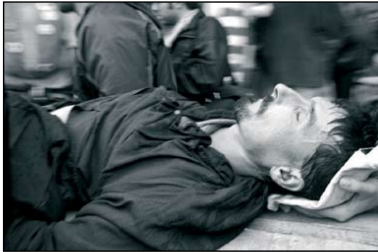
صربستان، 2000، یک تظاهرکننده مجروح

یک روش ساده ولی موثر برای انتخاب تاکتیکهای بی خشونت، تجزیه تحلیل هزینه فایده است. برای هر حرکت در نظر گرفته ، ضروری است که هزینه - فایده های احتمالی برای حرکت و نتیجه آن بررسی شود