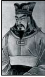
سان تزو، استراتژیست مشهور چین باستان